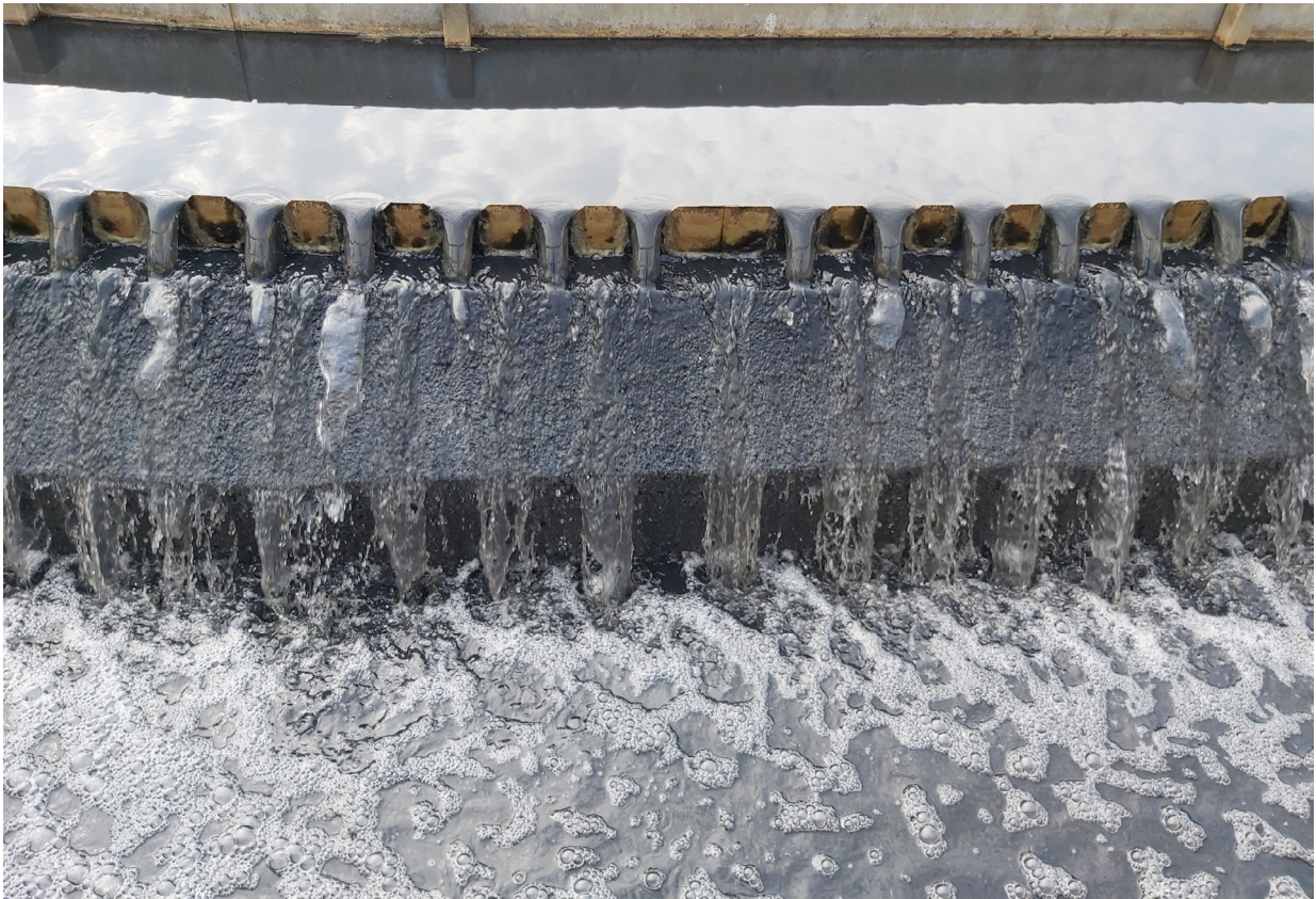
Kuva 3. Jätevedenpuhdistamon jälkiselkeytysaltaan reuna.

Energiakatselmuksen tulee tuottaa riittävän yksityiskohtaista dataa, jotta ehdotetuista energiansäästötoimenpiteistä ja mahdollisista säästöistä saadaan selkeää tietoa. Energiatehokkuusdirektiivissä (2023/1791) todetaan, että energiakatselmuksissa tulee ottaa huomioon asiaankuuluvat eurooppalaiset ja kansainväliset standardit (EN ISO 50001, EN 16247-1, EN ISO 14000). Näiden lisäksi parhaillaan ollaan kehittämässä energiakatselmuksia koskevaa eurooppalaista standardia.