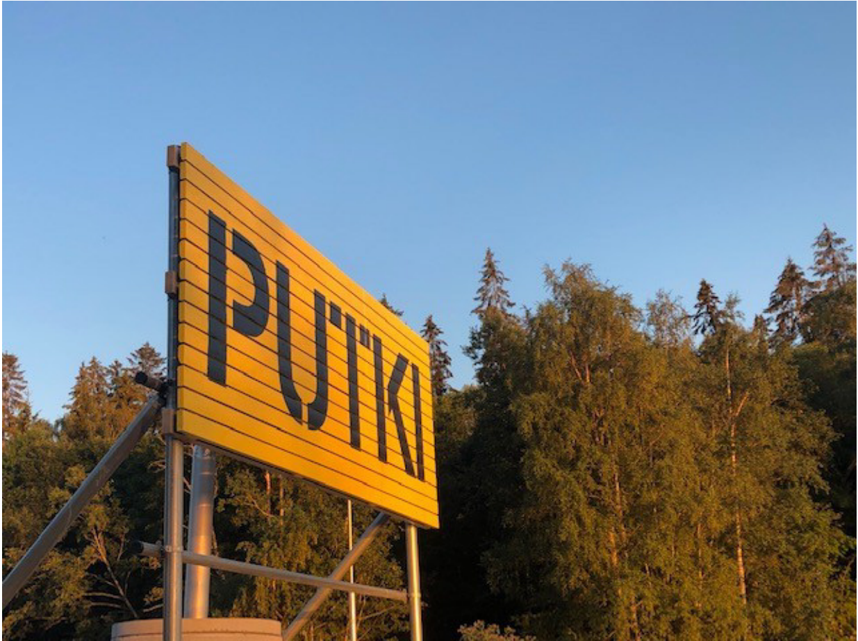
Kuva 2. Jätevedenpuhdistamon purkuputki merkitty kyltillä.

Hankkeessa tehty tarkastelu rajattiin koskemaan sekä jäteveden- että lietteenkäsittelyn energiankulutusta ja molempiin osa-alueisiin liittyvää energiantuotantoa. Lisäksi viemäriverkostot olivat mukana tarkastelussa jäteveden pumppauksen osalta.